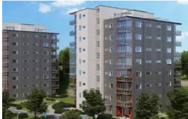
Prisma, hus B och C