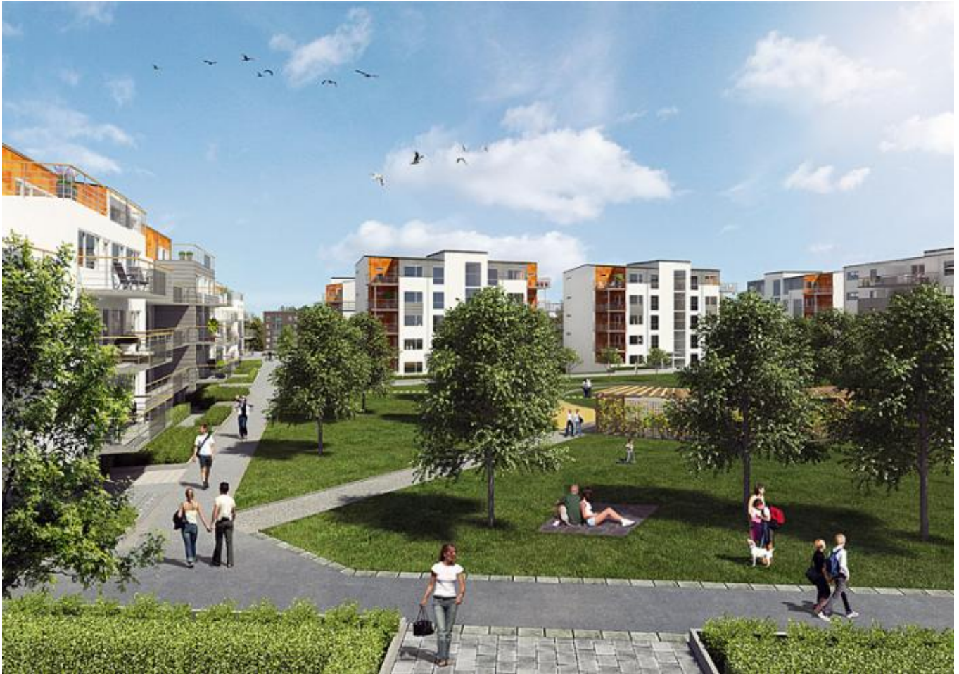
Kvibergs Terrass, hus 7 och 9