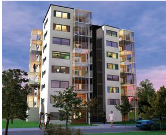
Motellvägen 2-4