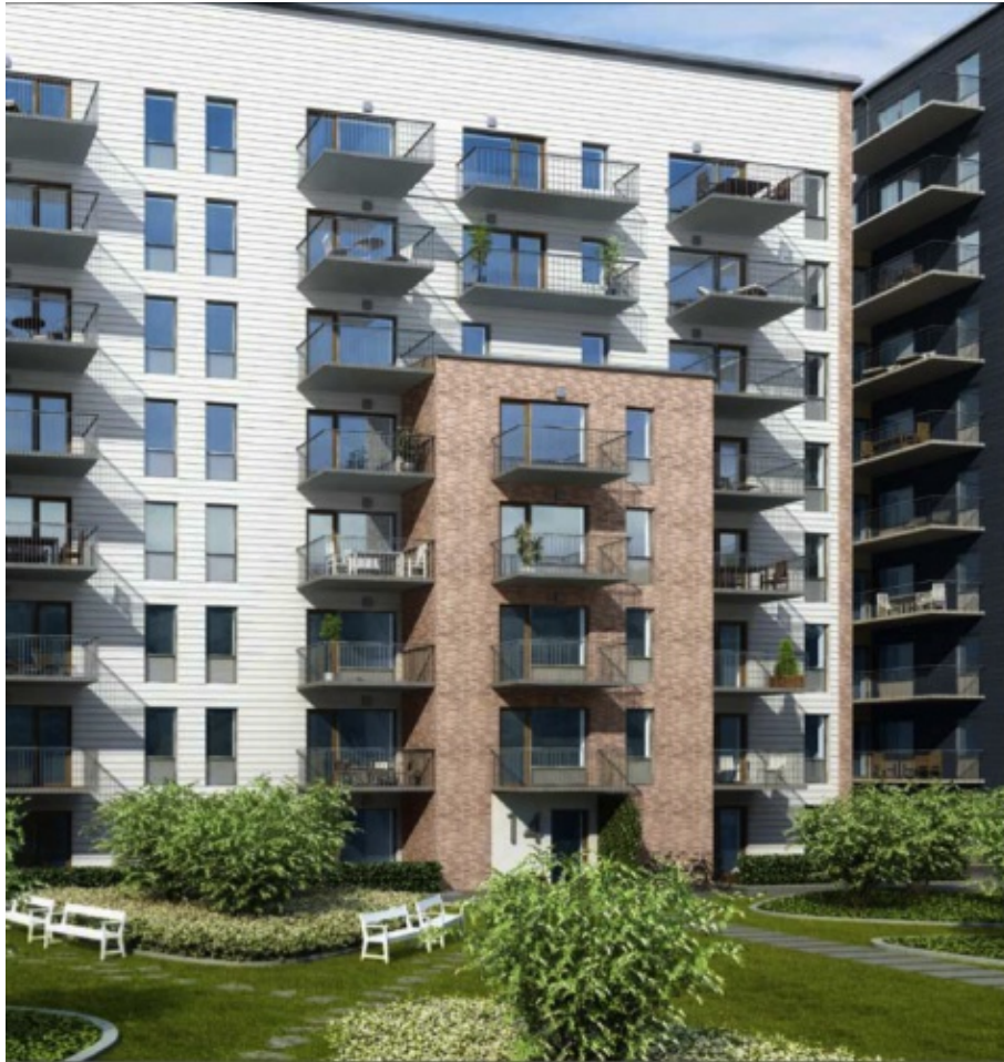
Kvillebäcken Lamellhus