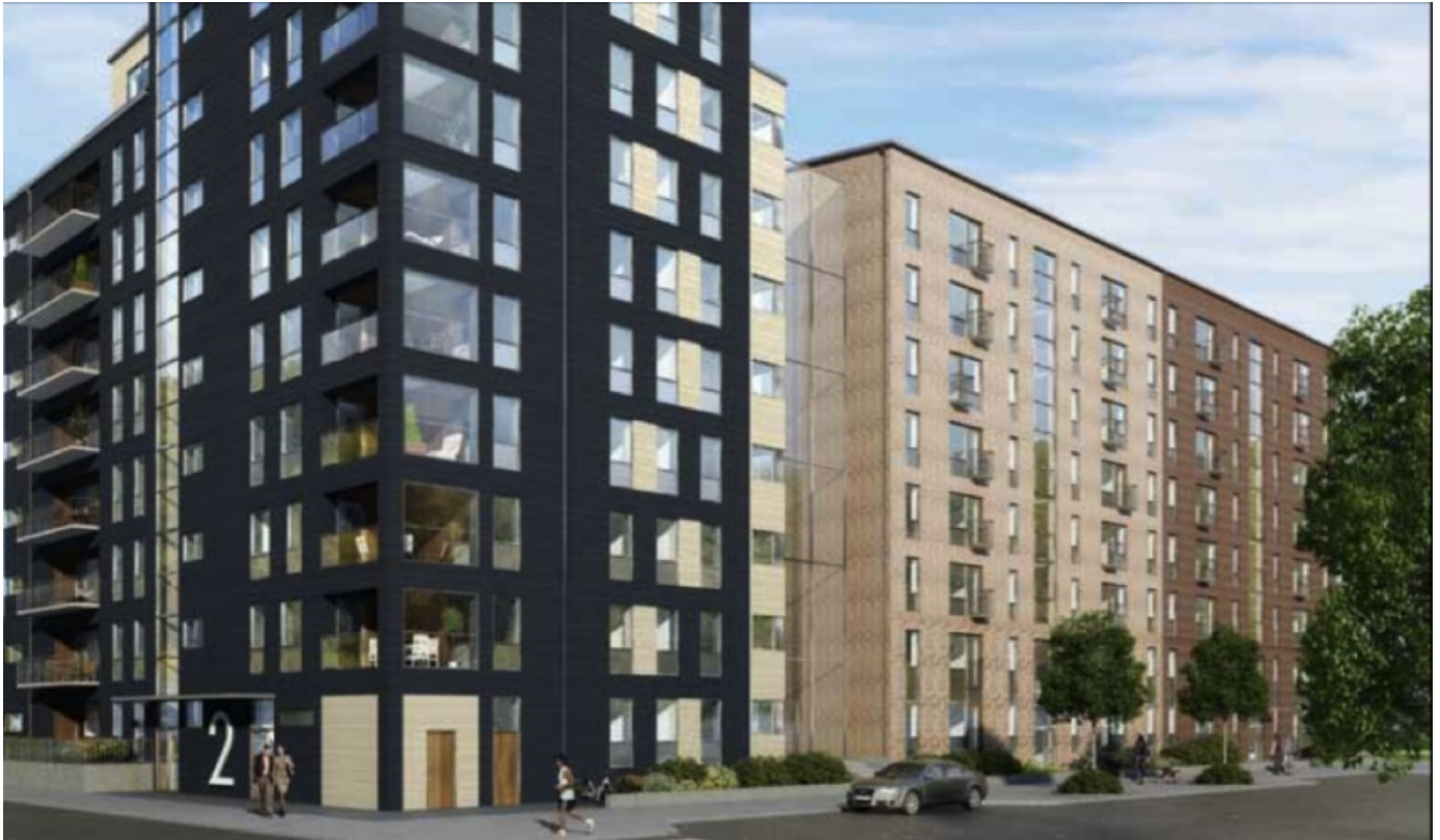
Kvillebäcken, NCC Punkthus