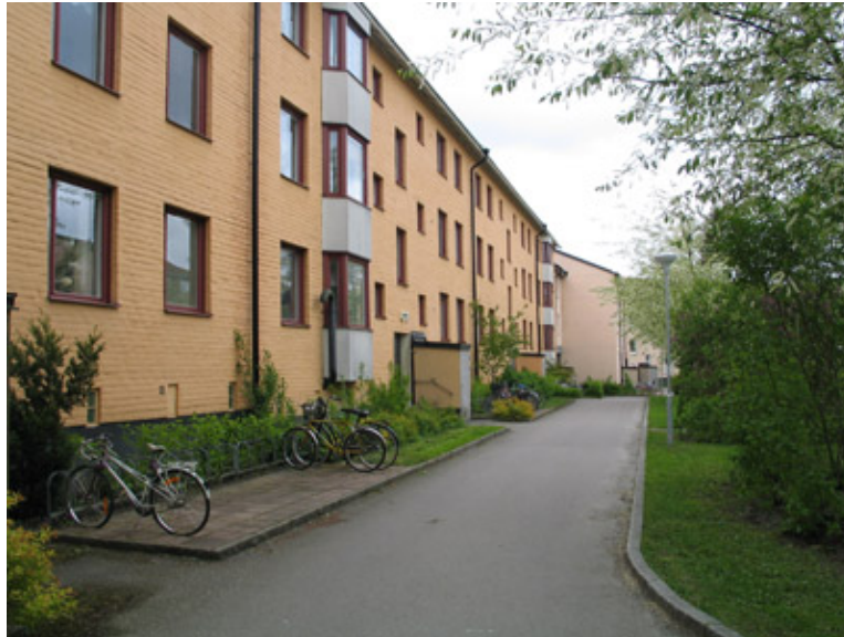
Johannesbäcksgatan 48 A-B