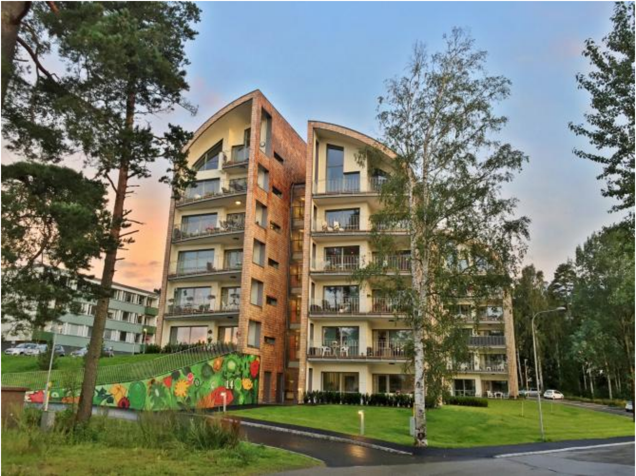
Trähusen på Åsbovägen i Fristad