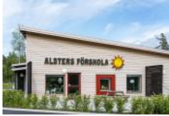
Alsters förskola © Felix Gerlach