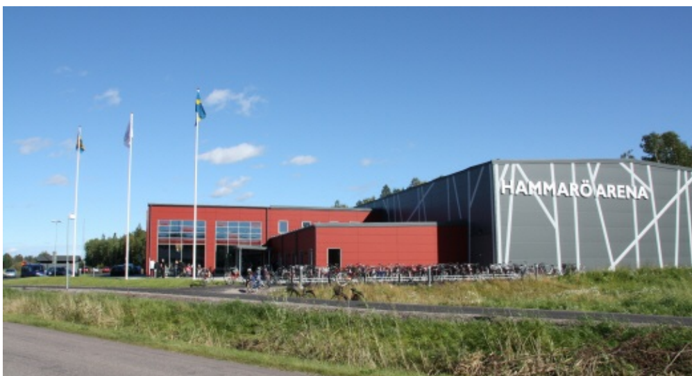
Hammarö Arena