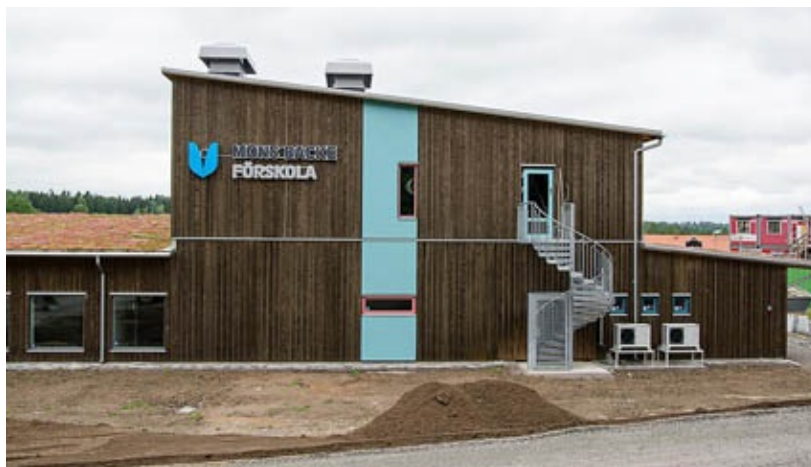
Mons Backe Förskola