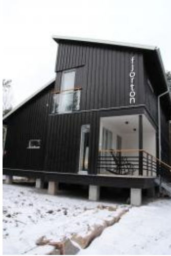
Villa i Karlstad