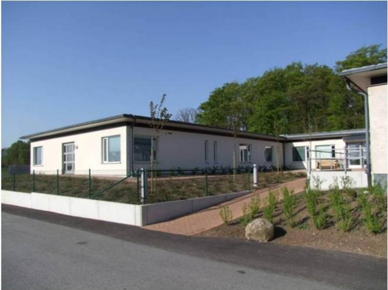
Boklidens Äldreboende