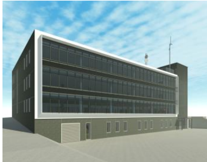
NTC-Huset © Liljewalls